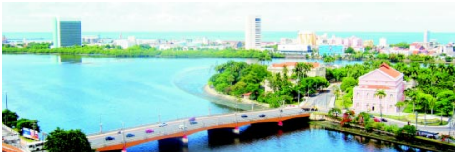
INTEGRAÇÃO – Rio divide a área central do Recife e banha outros 41 municípios do Estado

Meio Ambiente: A entidade participa de comitê para garantir o bom uso do Capibaribe pela sociedade