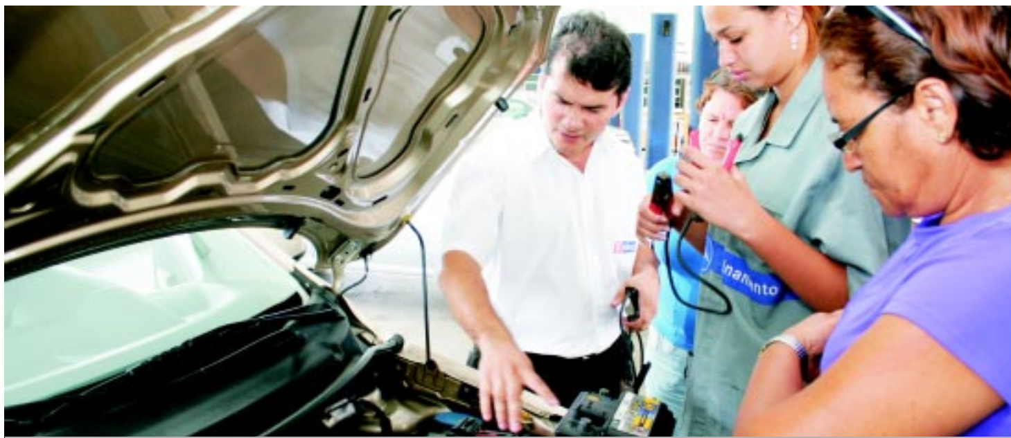
CONQUISTAS – As mulheres vêm ampliando seu espaço em áreas antes predominantemente masculinas

Capacitação: Nos últimos cinco anos, o número de alunas aumentou mais de 160%