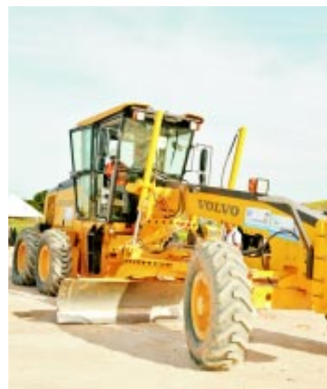
PARCERIA - Equipamentos são cedidos

Após a capacitação dos 1.050 profissionais, o projeto deverá ser levado para o interior do Estado, garantindo que a qualificação de mão-de-obra não fique restrita aos empreendimentos do litoral pernambucano.