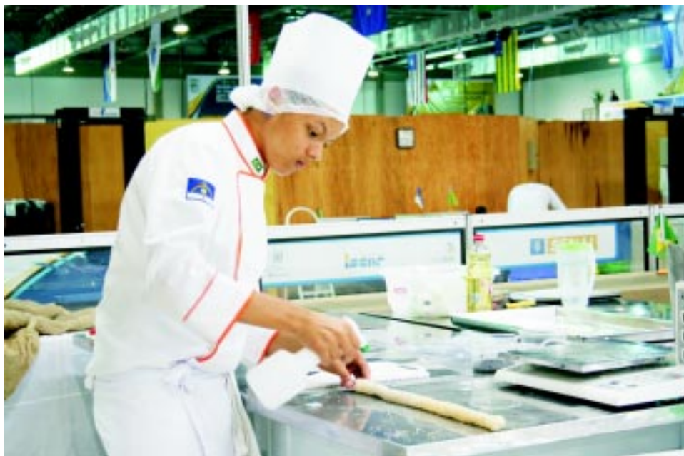
Mão-de-obra - Alunos passarão por treinamento para atender às demandas do setor

Os aprendizes serão treinados para suprir necessidades nas áreas de atendimento ao cliente, produção, gestão de equipes e de negócios. Para panificação, componentes de importante diferencial competitivo. O período de qualificação remunerada é